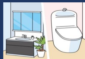
洗面化粧台 多機能便座

*1【システムキッチン】システムキッチンの標準構成に含まれるビルトインタイプのIHクッキングヒーター（またはガスコンロ）、レンジフード、食器洗い乾燥機、浄水器、電動昇降ユニット、ビルトインオープン、混合水栓を含みます。