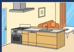
システムキッチン *1